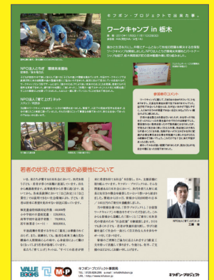
広報物作成事例：NPO法人 育て上げネット A4フライヤー