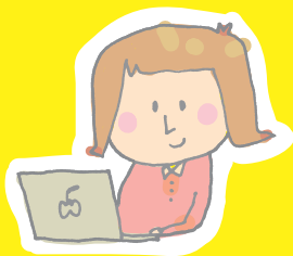
クリエイター志望の学生